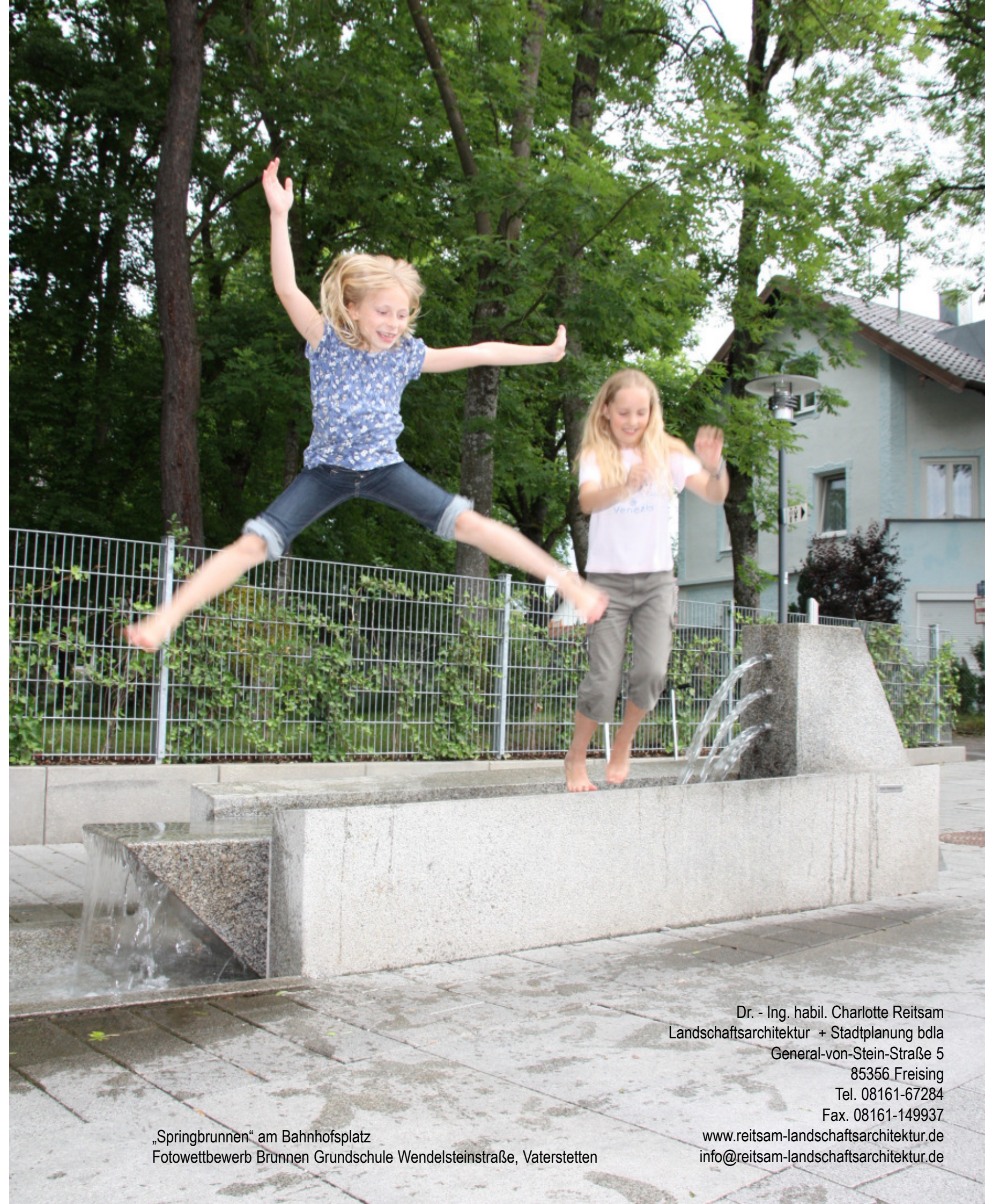
„Springbrunnen“ am Bahnhofplatz Fotowettbewerb Brunnen Grundschule Wendelsteinstraße, Vaterstetten