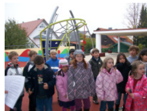
Sanierung Terrasse Kinderhort Neustift II Bauherr Stadt Freising