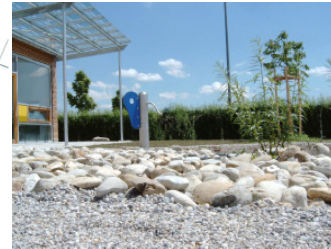
Repräsentative Gestaltung des S-Bahnhofplatzes Vaterstetten Grundwasserbrunnen, Kaskaden und Wasserfälle Bauherr Gemeinde Vaterstetten