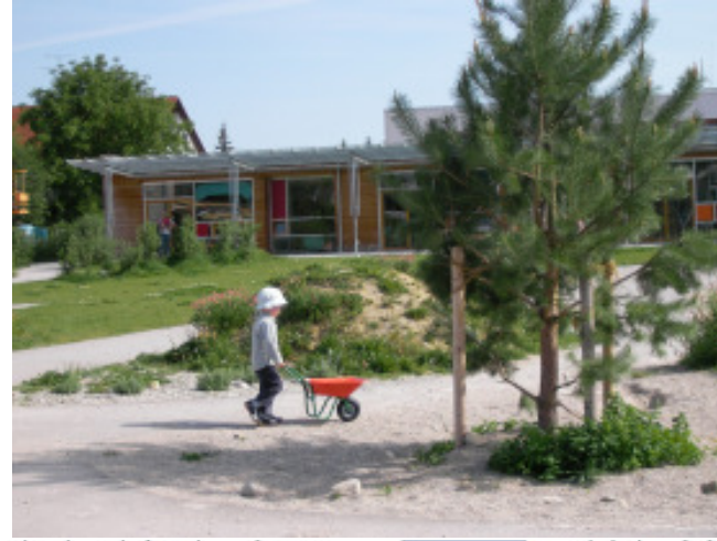
„Spielen am Fantasiefluss“ - Naturnahe Außenanlagen Kindergarten Katharina-Mair-Straße Bauherr Stadt Freising, Preis „Gute Baugestaltung im Landkreis Freising“