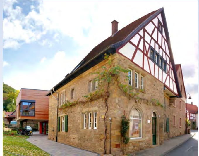
Betriebsgebäude in Odernheim am Glan

Seit 25 Jahren begleitet, planen und steuern wir die unterschiedlichsten Bauprojekte. Von der persönlichen Beratung und Entwurfsplanung über ökologische Erfassungen und Gutachten bis hin zur Umsetzung sowie Überwachung des Bauvorhabens - wir bieten Kompetenz in allen Planungsphasen. Durch die hausinterne interdisziplinäre Zusammenarbeit können wir außerdem umfassende sowie komplexe Planungen wie auch innovative und individuelle Lösungen anbieten.